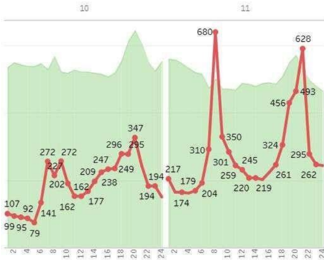
Динаміка ціни бази (Євро/МВт*год)