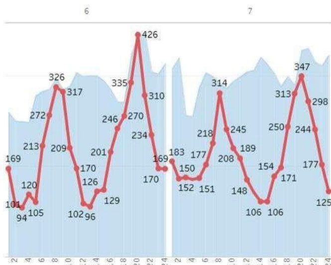
Динаміка ціни бази (Євро/МВт*год)